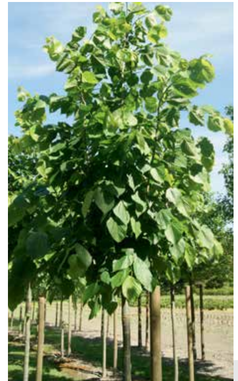
Bild 8 Tilia americana 'Redmond'