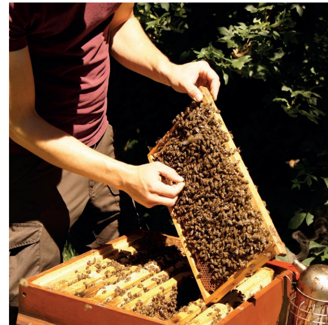
Fangen der Königin.