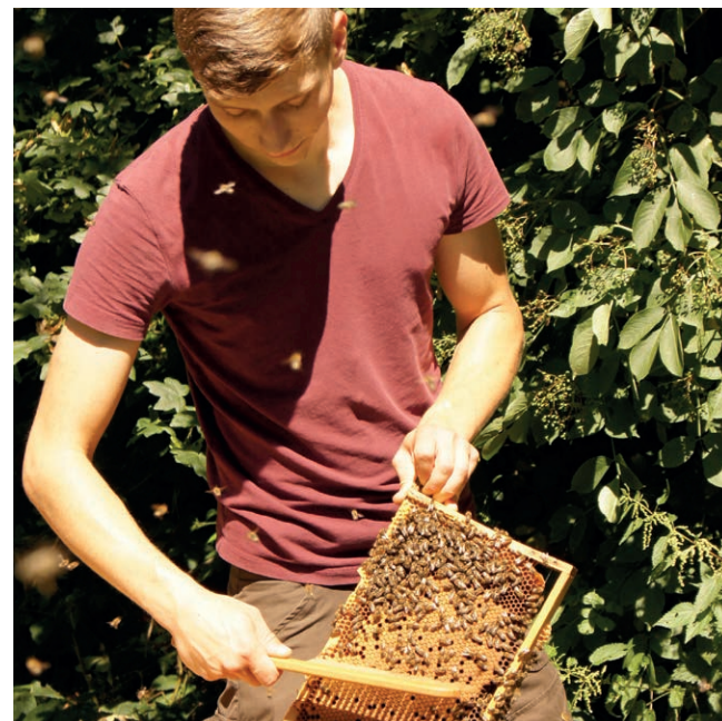
Abfegen der Bienen.

In der nebenstehenden Abbildung wird der Anstieg der Milbenzahl in einem nicht geschwärmten, unbehandelten Volk gut ersichtlich. Die steigende Zahl der Milben bei gleichzeitig abnehmender Brutaktivität der Bienen sorgt dafür, dass die verbleibende Brut im Spätsommer immer stärker parasitiert wird. Die typische zweigipflige Brutkurve der behandelten Völker verdeutlicht hingegen die Auswirkungen einer Brutpause, wie sie z. B. im Zuge des Schwärmens auftritt. Die Bienen gehen nach der Unterbrechung rasch wieder in Brut, während die Milbenpopulation langfristig geschädigt ist. Im Vergleich zu den unbehandelten, ungeschwärmten Völkern ist die Milbenanzahl deutlich reduziert.